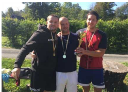
1. místo - Havířovští draci