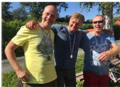
2. místo - Žermanice Pustky