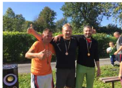
3. místo - Žermanice United